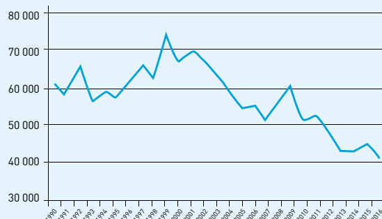
Bewegingen 1990 - 2016

Het faillissement van VLM Airlines, in juni 2016, is ook te merken in de resultaten, waarbij we sinds juni 2016 maandelijks een lichte terugval noteren in passagiersaantallen t.o.v. 2015.